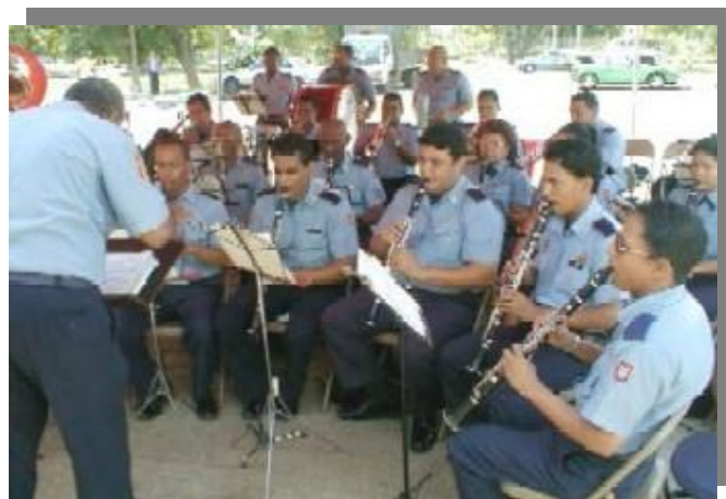
Banda de Música del Cuerpo de Bomberos