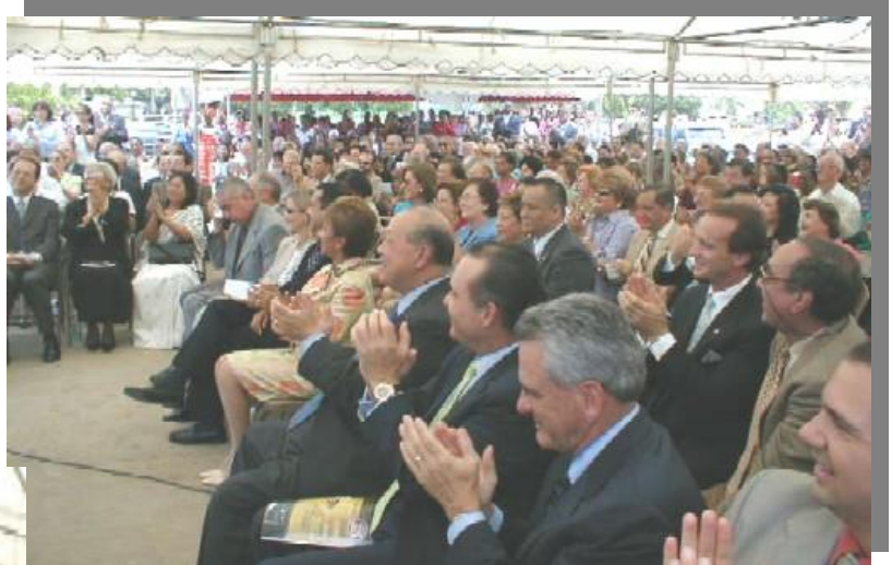
Vista parcial del público