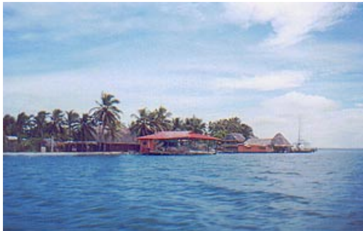
Trayecto en Lancha hacia Isla Colón, Bocas del Toro.