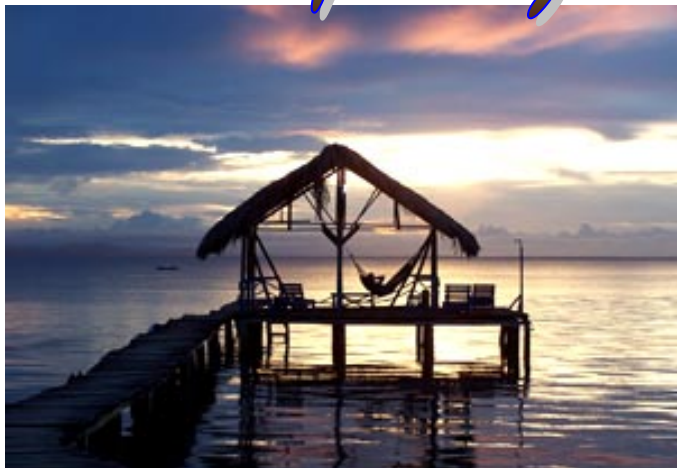
Centro de buceo de Punta Manglar, en Isla Colon.