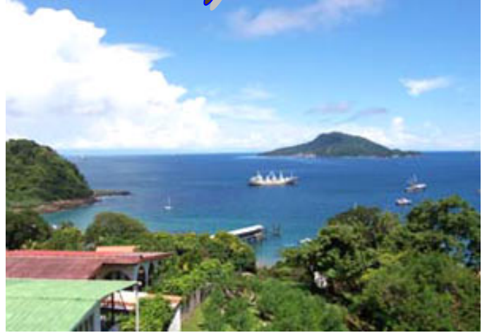
Isla de Taboga