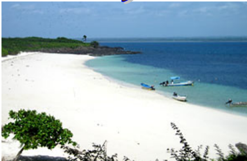
Isla Iguana