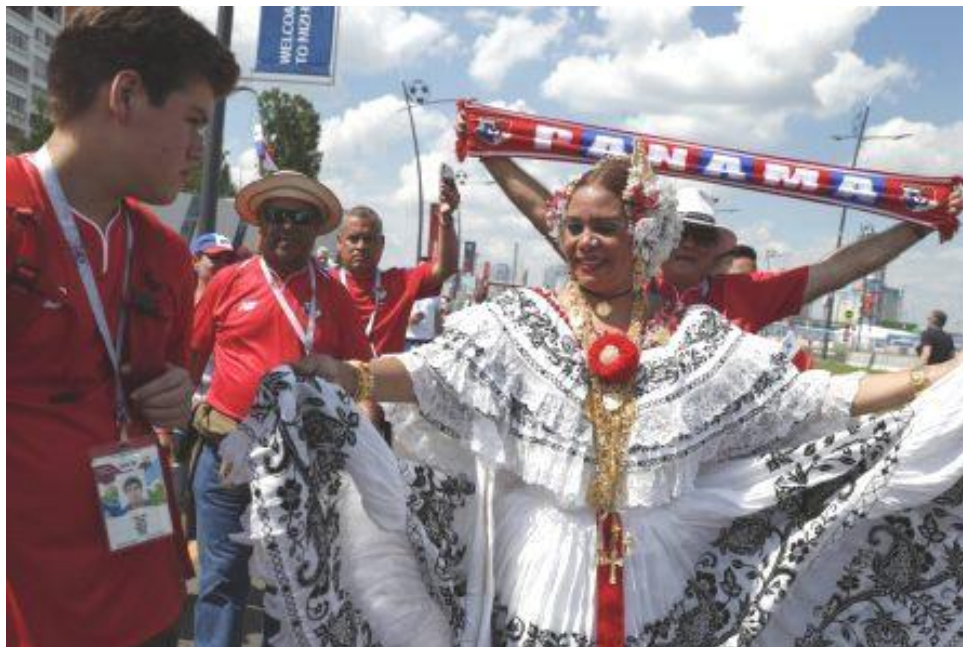
Se formó la fiesta a las afueras del estadio, junto a la empollerada y la marea roja.