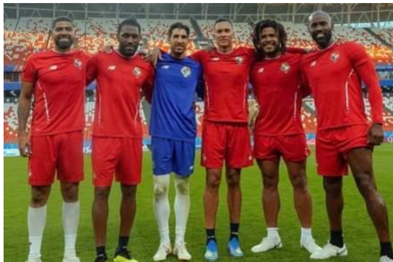
Gabriel Gómez (34), Luis Tejada (36), Jaime Penedo (36), Blas Pérez (37), Román Torres (32) y Felipe Baloy (37)

https://deportes.canalrcn.com/copa-mundial-de-la-fifa-rusia-2018/noticias/seis-jugadores-se-despiden-de-la-seleccion-panamena