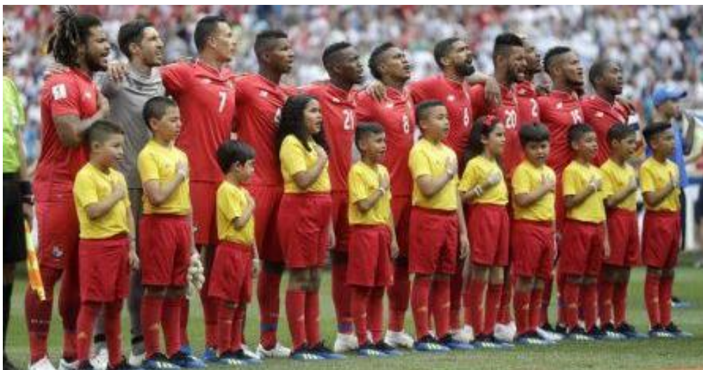
Nuestra Sele en compañía de niños panameños durante la entonación de nuestro himno.